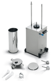
Very easy to clean