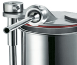
Bush in s/s optional