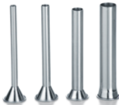
Funnels in s/s ø 13-16-20-38