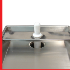
- Amplia bandeja - Protección de manos